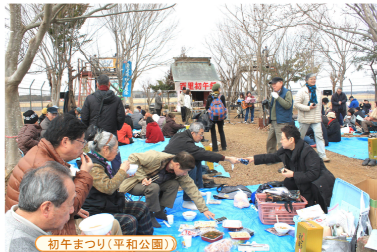
初午まつり(平和公園)