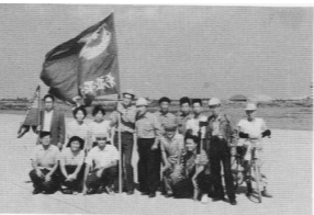
滑走路完成直前 1964年当時