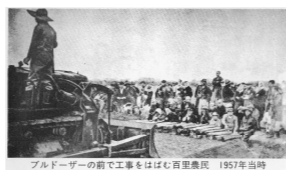
ブルドーザーの前で工事をはばむ百里農民 1957年当時