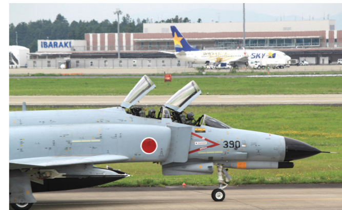
民間機と軍事訓練する軍用機が同居する航空自衛隊百里基地